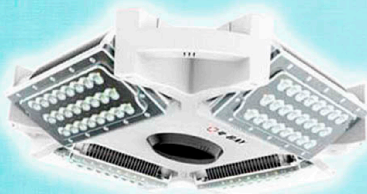
Multimódulo Direccional de Alta Potencia 200W 30-60-120°